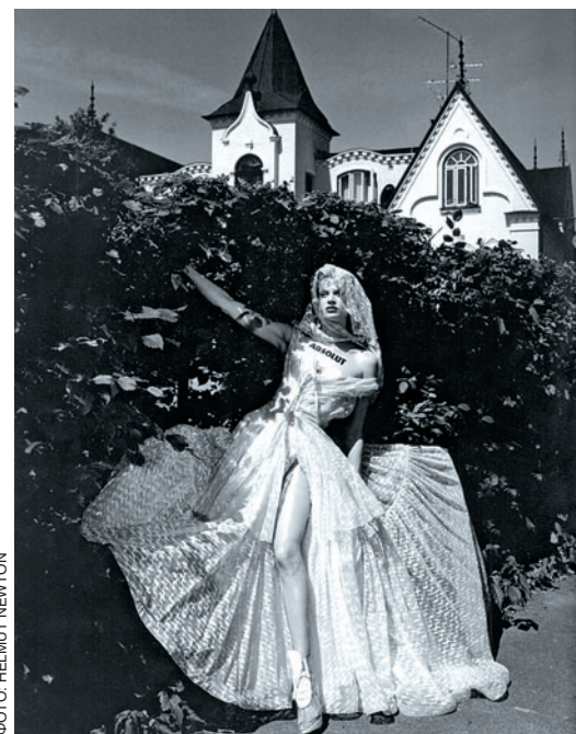
ФОТО: HELMUT NEWTON

Х ельмут Ньютон однажды сказал: «Чьи-то снимки — это искусство. Только не мои. Если их выставляют в музее или галерее, это отлично. Но я фотографирую по иным соображениям. Я — наемный стрелок». Так и переводится «gun for hire». Столь прозаичная прокламация из уст одного из наиболее воспетых фотографов XX века, разумеется, не может не шокировать, но, вместе с тем, выражает твердую, без прикрас, позицию Ньютона: он всегда считал себя не более чем одаренным имиджмейкером. Но и такой подход дал свои плоды: как известно, среди наиболее именитых клиентов фотографа — Versace, Absolut и Chanel. В альбом вошли и последние снимки мастера — сделанные для американского и итальянского Vogue в 2003 году. Возможно, читательницам этих журналов и есть дело до того, кто творец, а кто ремесленник. Пускай. Для нас важно, что это Ньютон — человек, не мало повлиявший на фото XX, да и XXI столетий.