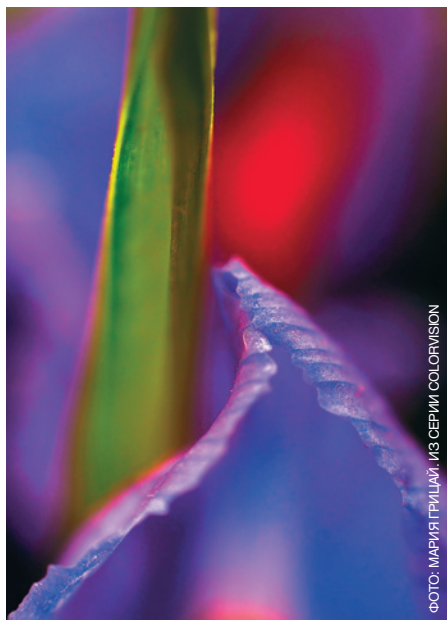
ФОТО: МАРИЯ ГРИЦАЙ. ИЗ СЕРИИ COLORVISION