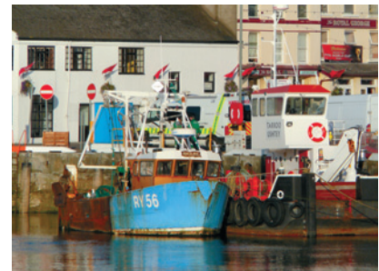
Максимальный зум Наличие оптического стабилизатора положительно сказывается на резкости.

«Lumix TZ1 оказалась удачной моделью, несмотря на отсутствие ручных режимов пользователь не почувствует себя ограниченным в возможностях»