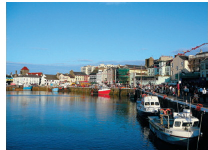
Широкий угол Изображение имеет минимальный уровень дисторсии.