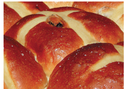
Макро Минимальное расстояние при макросъемке — 5 см. Похвально для столь мощного зума.