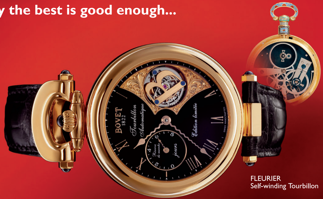
FLEURIER Self-winding Tourbillon