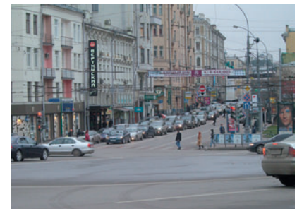
Максимальный зум Возможностей объектива достаточно для многих любительских задач.

«Несмотря на внушительные размеры экрана, толщина корпуса составляет всего 17 мм, что позволяет камере чувствовать себя очень уютно в кармане рубашки или в дамской сумочке»