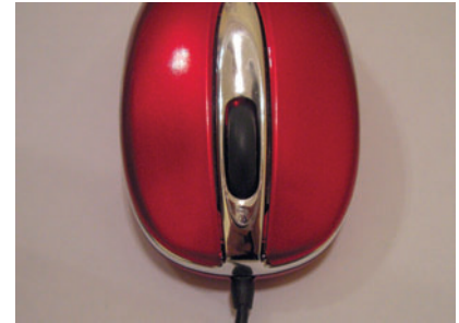
Макро Минимальная дистанция съемки — 15 см.