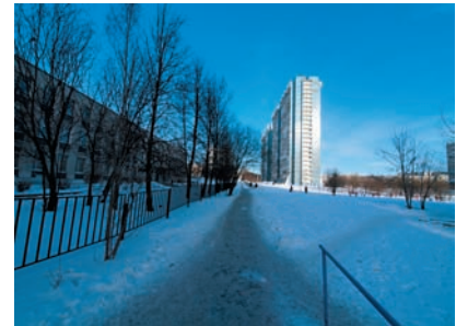
Широкий угол Максимальный угол зрения в системе 4/3 составляет 114 градусов.