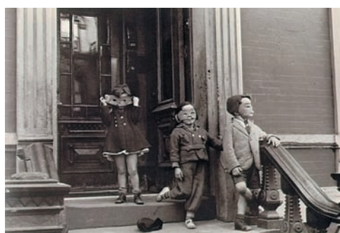
Хелен Левитт. Нью-Йорк

фигур в лесу, в жилой комнате или в покинутом всеми коттедже. Тут было, несомненно, подлинное человеческое тело, однако пока обнаженные фигуры представляли