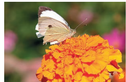
Автофокус Точность работы автофокуса завораживает.

«Техническое оснащение E-510 делает ее эффективным и универсальным фотографическим инструментом, управление просто и понятно»