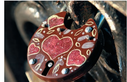
Оптика Детали не потеряются, качество оптики на высоте.