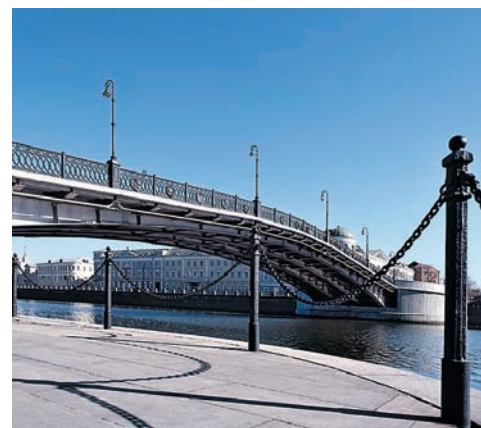
Линейная и искусственная тональная перспективы

Линию горизонта желательно не располагать по центру снимка — лучше сместить ее вверх или вниз и перебивать вертикалями. Иногда трудно сразу понять, где лучше расположить горизонт: в верхней части кадра или в нижней. В этом случае сделайте два кадра, а потом сравните их на мониторе и выберите окончательный вариант. Линию го-