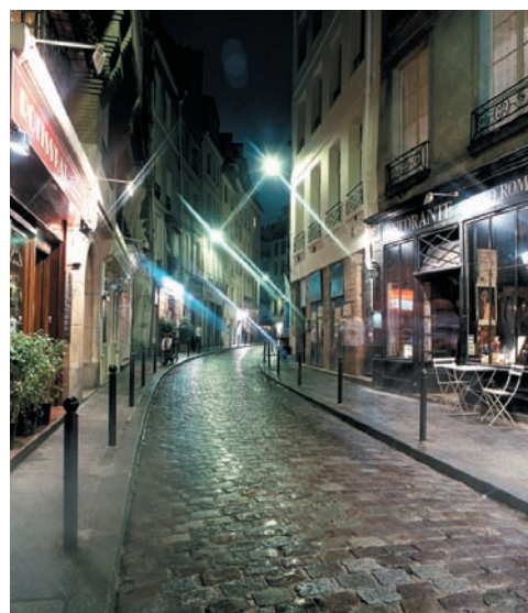
Латинский квартал в Париже. Левый кадр снят на пленку, сбалансированную под дневной свет, правый — под вечерний. Мне кадр справа нравится больше

ризонта следует перебивать вертикальными деталями — деревьями, зданиями и т. д. Однако любая вертикаль — телеграфный столб, ствол дерева, мачта — испортят почти любой снимок, если пересекут его снизу доверху.