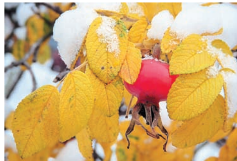
Качество изображения Хорошая и натуральная цветопередача даже в условиях недостаточной освещенности.

Объектив S51 нельзя назвать светосильным, но система самой настоящей оптической стабилизации и расширенная до ISO 1600 чувствительность компенсируют этот недостаток, а 3-кратный оптический зум обеспечивает необходимую функциональность. Объектив встроен внутрь корпуса ка-