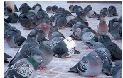
Максимальный зум В максимальном положении зума картинка не вызывает нареканий.