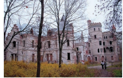
Широкий угол На широком угле дисторсия весьма заметна.