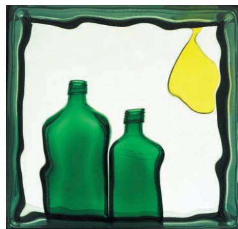
Фото 20. Яичница