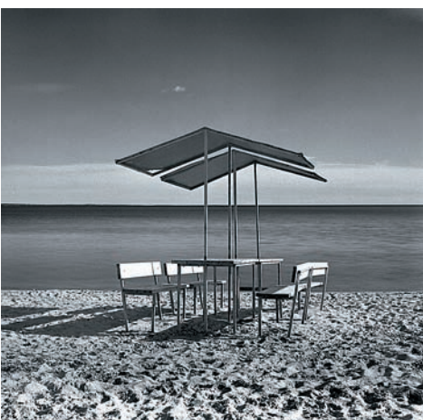
Фото 17. Лунная ночь на Днепре

«Спасибо товарищу Хосе. Мы не стали копировать реальность, мы «нарисовали» идею и избежали поражения»