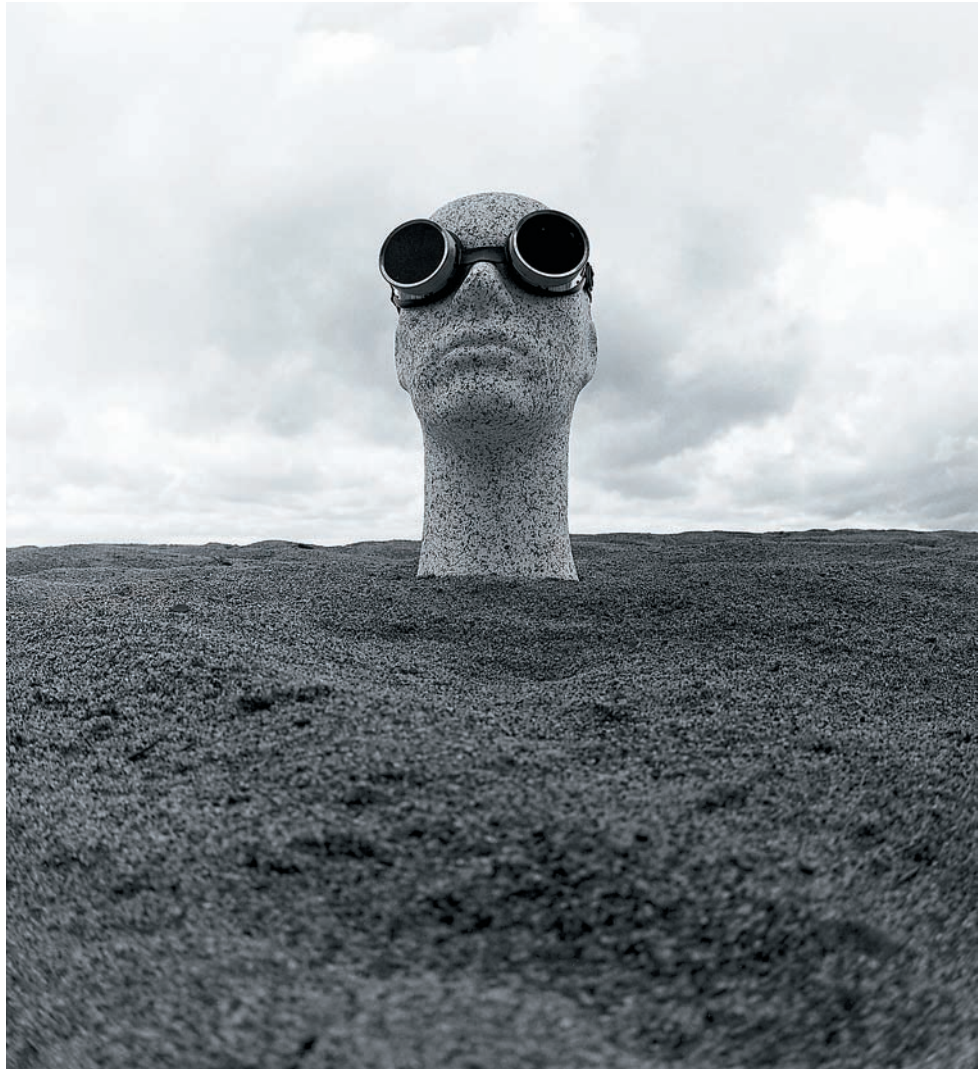
Фото 18. Остров Пасхи

Конечно, то, что получилось, совсем не то, что видим мы в реальности. Но еще Хосе Ортега-и-Гассет, размышляя о дегуманизации искусства, говорил: «Художник-традиционалист, пишущий портрет, претендует на то, что он погружен в реальность изображаемого лица, тогда как в действительности живописец самое большее наносит на полотно схематичный набор отдельных черт, произвольно подобранных сознанием,