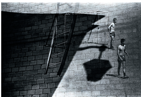
Фото 32. Когда качаются фонарики ночные