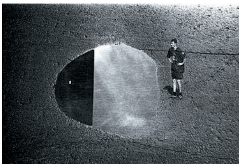
Фото 31. В речку мячик

Поэтому, отщелкав пленочку, бросаем ее в холодильник. Через полгода там таких скопится уже штук тридцать, и мы совсем забыли, что снимали. Теперь спокойно, перекрестясь, одну из кучи выбираем и заряжаем еще раз в фотоаппарат. Опять снимаем, проявляем, смотрим, что получилось. Ничего не получилось? Как бы не так! «Есть многое на свете, друг Горацио, что недоступно нашим мудрецам», — сказал