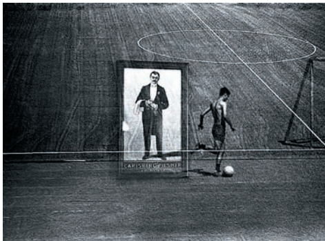
Фото 30. Штрафной

фотография». Б. Ф. Плужников, автор книжки, пишет: «Нельзя беспорядочно нагромождать одно изображение на другое. Необходимо предварительно наметить будущую композицию кадра, которую и принять в качестве основы для всей дальнейшей работы». Ну, понятно, во времена повального атеизма и веры в человеческий разум можно было часами заранее думать о композиции. Мы с вами, слава богу, не в шестьдесят седьмом году, и в человеческий разум верить — дураков, как говорится, нету.