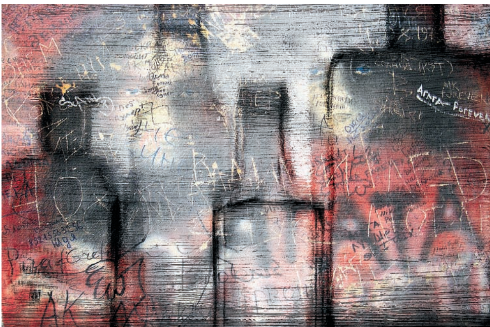
Фото 34. Опиум курить

«Во времена повального атеизма и веры в человеческий разум можно было часами заранее думать о композиции»