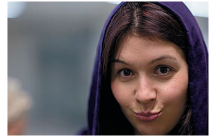
Ручная фокусировка Камера имеет подтверждение точной фокусировки при ручной наводке, но специальный фокусирующий экран не помешает.