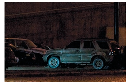
Шумы в тених Кноп 100%. На ISO 3200 шумы в тених незначительны.