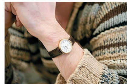
Детализация Очень высокая, на циферблате видны малейшие рисочки.

«ISO 25600 может оказаться вполне рабочей чувствительностью, если перевести картинку в ч/б»