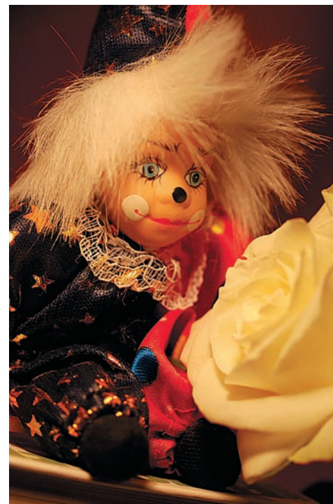
Баланс белого Стандартная проблема всех зеркалок: автобаланс белого при освещении лампами накаливания постоянно ошибается.

При поднесении камеры к глазу специальный датчик видеискателя заботливо отключит ЖК-экран, чтобы он не мешал и не расходовал зря заряд аккумулятора. Вообще, хочется отметить дружелюбный интерфейс камеры и имеющиеся возможности его настройки. Для творческой зоны и зоны автоматических программ можно задать разное отображение меню — графическое или строгое текстовое, можно также задать цвет фона. Можно «спрятать» ненужные вам пункты меню, чтобы меньше отвлекаться от процесса и ускорить доступ к нужными параметрам. При повороте камеры изображение на ЖК-мониторе также поворачивается для удобства визирования. Огромное количество подсказок поможет новичку