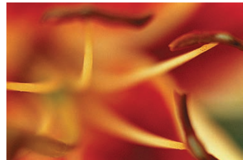
Цветок лилии, тычинки. Nikon FM2, «Волна-9», солнечный день, съемка с рук

Ну и последнее, о чем мне хотелось сказать, чтобы подбодрить начинающих фотографов, напуганных моей же статьей. Большинство иллюстраций к ней сняты простым пленочным фотоаппаратом Nikon FM2 со старым советским объективом «Волна-9», присоединенным через переходное кольцо. Освещение же — естественный дневной свет на открытом воздухе или из окна.