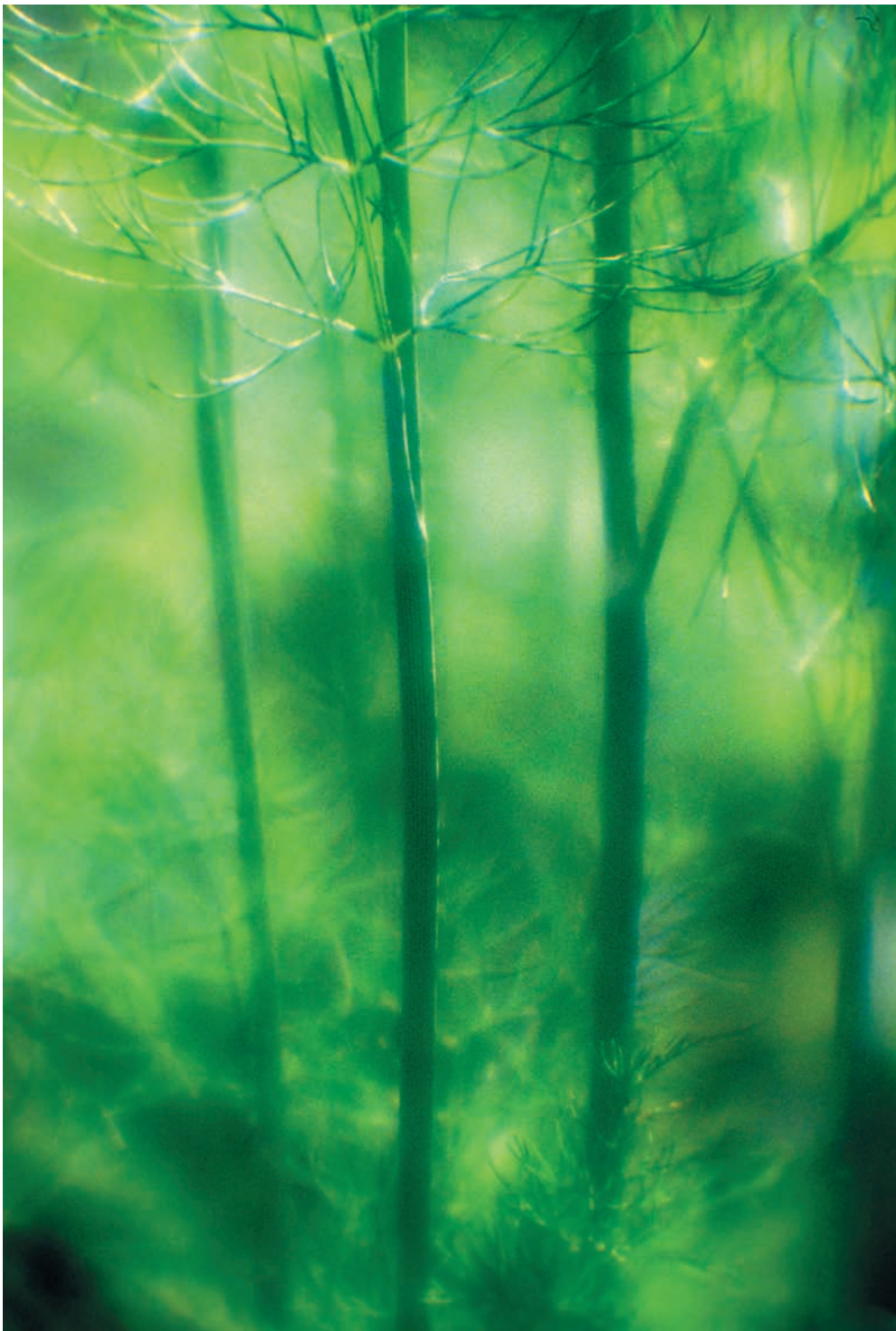
Мягкорисующий объектив («монокль»), удлинительные кольца — и грядка с укропом превращается в таинственный лес. Nikon FM2, съемка с рук

сейчас весьма широк, и главное, чтобы фотографу было удобно как носить свою технику, так и добираться до нее, когда дело доходит до съемки.