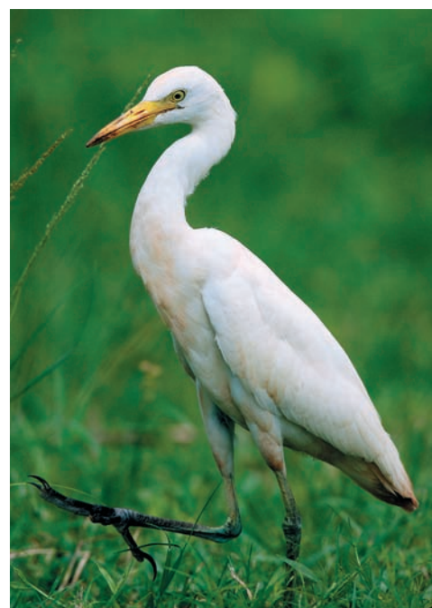
Шагающая египетская цапля — вечный спутник крупного рогатого скота

попугая. Мы уже видели его в Сороа, но тогда я не обратил на него особого внимания. Здесь же он оказался очень близко, на кусте в двух-трех метрах от нас, и распевал свою песенку. Тоди — не просто красавец, он просто какой-то герцог в царстве пернатых. Одетый в яркий зеленый камзол и розовую рубашу с красным шейным платком, он пел о том, как хороша его жизнь на Кубе. Он так гордился своей красотой, что не заметил, как мы подошли практически вплотную и стали его фотографировать. А может, и заметил, но не подал вида, да и с какой стати герцог должен замечать простых смертных? Поэтому сэр Тоди не унимался и продолжал петь свою серенаду, так что даже казалось, что можно подойти и взять его в руки, а он будет все также орать во все горло.