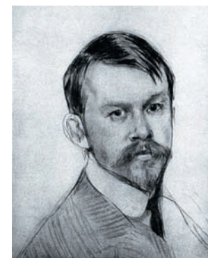
Б. М. Кустодиев. Автопортрет. 1902 г.

Борис Михайлович Кустодиев знаменит прежде всего колоритными портретами дородных купчих и картинами из русского быта. Мало кто знает, что он был еще и увлеченным фотолюбителем