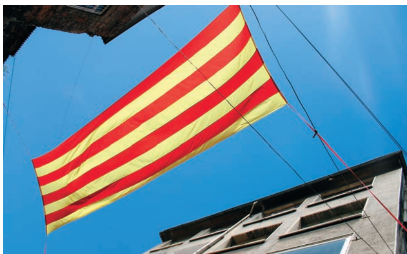
См. его портфолио на с. 70

40 ТЕМА НОМЕРА Декоративная провокация Что снимает «для себя» человек, профессия которого — безукоризненно выстраивать роскошные глянцево-рекламные фотографии?