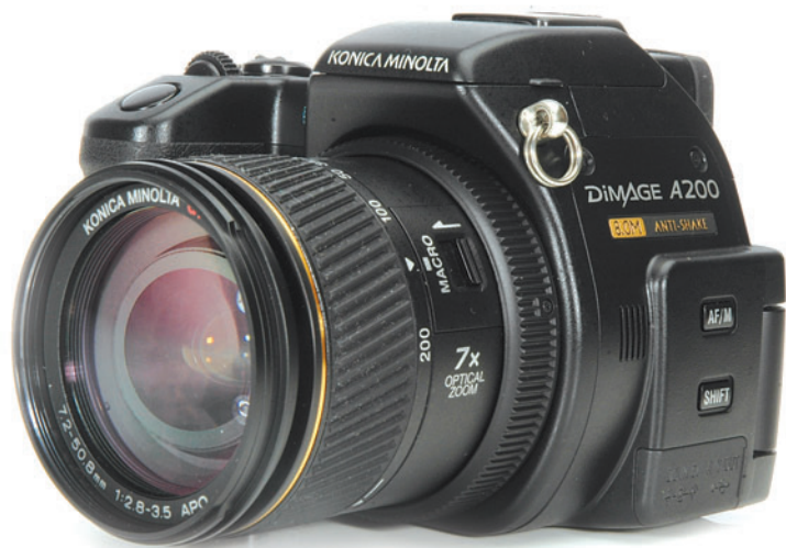
Многие компании-производители выкладывают инструкции к своим камерам на фирменных сайтах.

При просмотре фотографий на экране камеры вид-