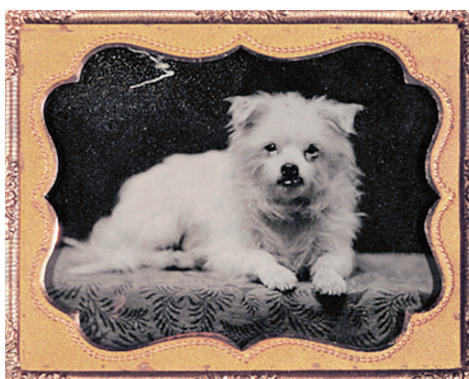
НЕИЗВЕСТНЫЙ АВТОР. АМБРОТИПИЯ С ИЗОБРАЖЕНИЕМ СОБАЧКИ. 1858 г.