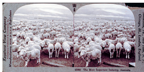
НЕИЗВЕСТНЫЙ АВТОР. САМАЯ ГЛАВНАЯ ПРОМЫШЛЕННОСТЬ АВСТРАЛИИ. 1920 г.

Серьезным поворотом в фотографии (и, в частности, в жанре анималистики) стали 70-е годы XIX века, так как в это время ученым удалось улучшить светочувствительность материалов. В 1874 году появился фотоаппарат-