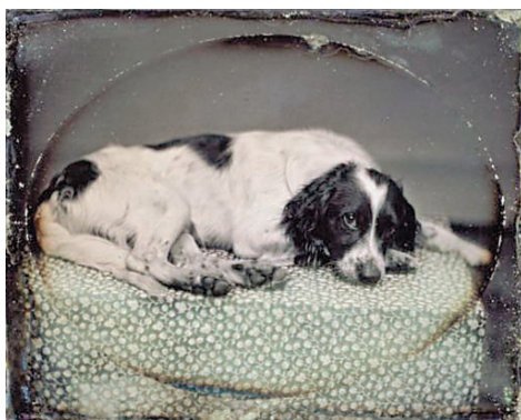
НЕИЗВЕСТНЫЙ АВТОР. ДАГЕРРОТИП С ИЗОБРАЖЕНИЕМ СОБАКИ. 1852–1853 г.