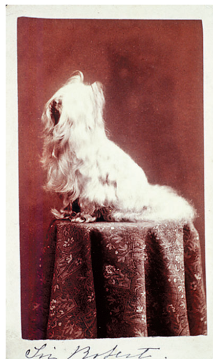
НЕИЗВЕСТНЫЙ АВТОР. АЛЬБУМИНОВЫЙ ОТПЕЧАТОК. 1865 г.