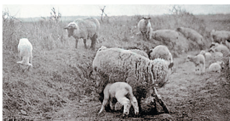
Р. ЭМЕРСОН. МАРТОВСКАЯ ПАСТОРАЛЬ. 1886 г.

За многовековую историю изобразительных искусств было создано немало художественных работ с изображением животных и растений. Возникло даже определенное «анималистический жанр» (от лат. animal — животное) — изображение животных в живописи, скульптуре и графике, которое сочетает в себе естественно-научные и художественные начала. Животных изображали на скалах, пирамидах, парадных портретах, священных книгах, одежде, посуде. В основном образ животного был связан либо с какими-то сакральными, магическими действиями (изображения на скалах, стенах гробниц), либо мог быть мифологического характера (греческие статуи — полулюди-полузвери), либо декоративно-прикладного (рисунки на кухонной утвари или в виде узоров на одежде), время от времени изображались как дополнение к парадному портрету хозяина. Встречаются картины, на которых запечатлены сценки охоты, зарисовки скотного двора, а также «персональные» портреты любимых питомцев по заказу состоятельного вельможи. В общем, каж-