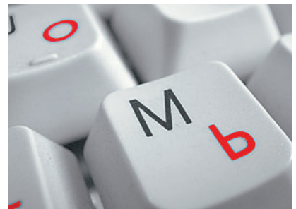
Макро Отличные возможности для такой конструкции объектива.