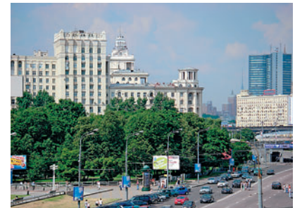
Максимальный зум И на максимальном зуме цветопередача на уровне.

«Фирма Pentax не первый год выпускает цифровые фотокамеры с защищенными корпусами. По традиции эти модели имеют в названии индекс W»