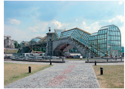
Широкий угол Дисторсия не слишком заметна.