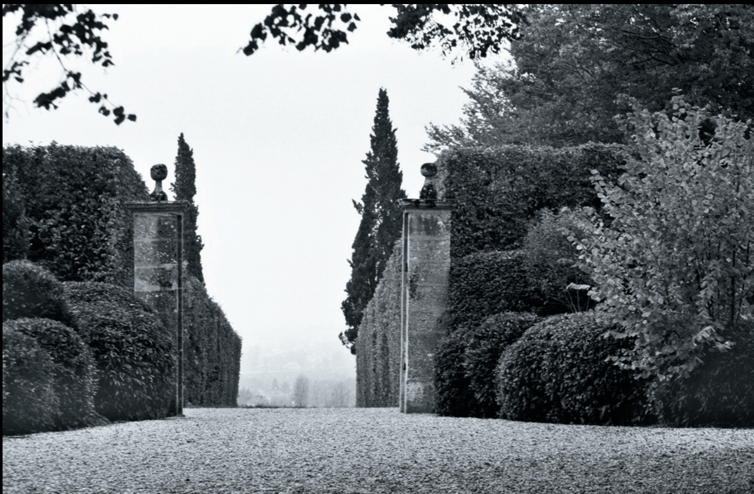
Туманы Сотерна. Малагар. Франция. 2002

...Сейчас многое меняется в фотографии. Из-за доступности цифры появилось бесчисленное множество незрелых, но прытких «творцов», и доля серьезных работ в процентном отношении уменьшилась катастрофически. Может быть, это наводнение схлынет или качественно переродится — не знаю. Но что интересно: в советские времена фотограф, профессионал во всяком случае, был опутан массой всевозможных ограничений, гласных и негласных, но эта ситуация оборачивалась плюсом: вынужденный работать в непростых условиях, он достигал большего. Вспомним, тогда каждый год несколько наших ребят обязательно выигрывали «Уорлд Пресс Фото» и получали «Золотой глаз» — а это объективные показатели, и такие награды воспринимались как обыденность. А сейчас это редкость. Так что ограничения оказываются полезны. Любая классическая школа — это сплошные ограничения. Но поживем — увидим.