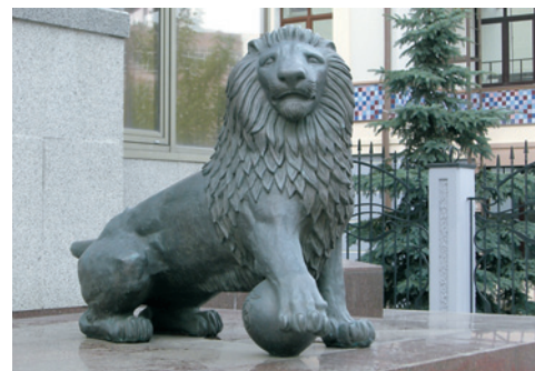
Качество изображения Стабилизатор изображения может очень пригодиться при съемке в пасмурную погоду или при недостаточном освещении.

Практически всю заднюю панель занимает огромный 2,8-дюймовый ЖК-экран, дающий четкую и яркую картинку. Рассмотреть изображение на нем не составит труда даже при ярком солнечном свете. Кроме того, в настройках фотоаппарата предусмотрена функция регулировки яркости экрана, позволяющая выбрать комфортные условия просмотра и заодно сэкономять никогда не лишнюю энергию аккумулятора. Оптического видеосъемателя в камере не предусмотрено, однако это не является недостатком для столь компактных устройств.