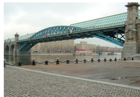
Качество изображения Матрица Super CCD позволяет получать качественные и четкие снимки.

Новинке от Fuji удалось сохранить одно из главных достоинств модели F10 — оперативность работы. Время включения, задержка спуска затвора, время наводки на резкость (при хороших условиях освещения) — все эти параметры не вызывают никаких нареканий. Ну а если съемка ведется при недостаточном освещении, то F30 немного теряет в скорости, но, тем не менее, заметных неудобств это не вызывает.