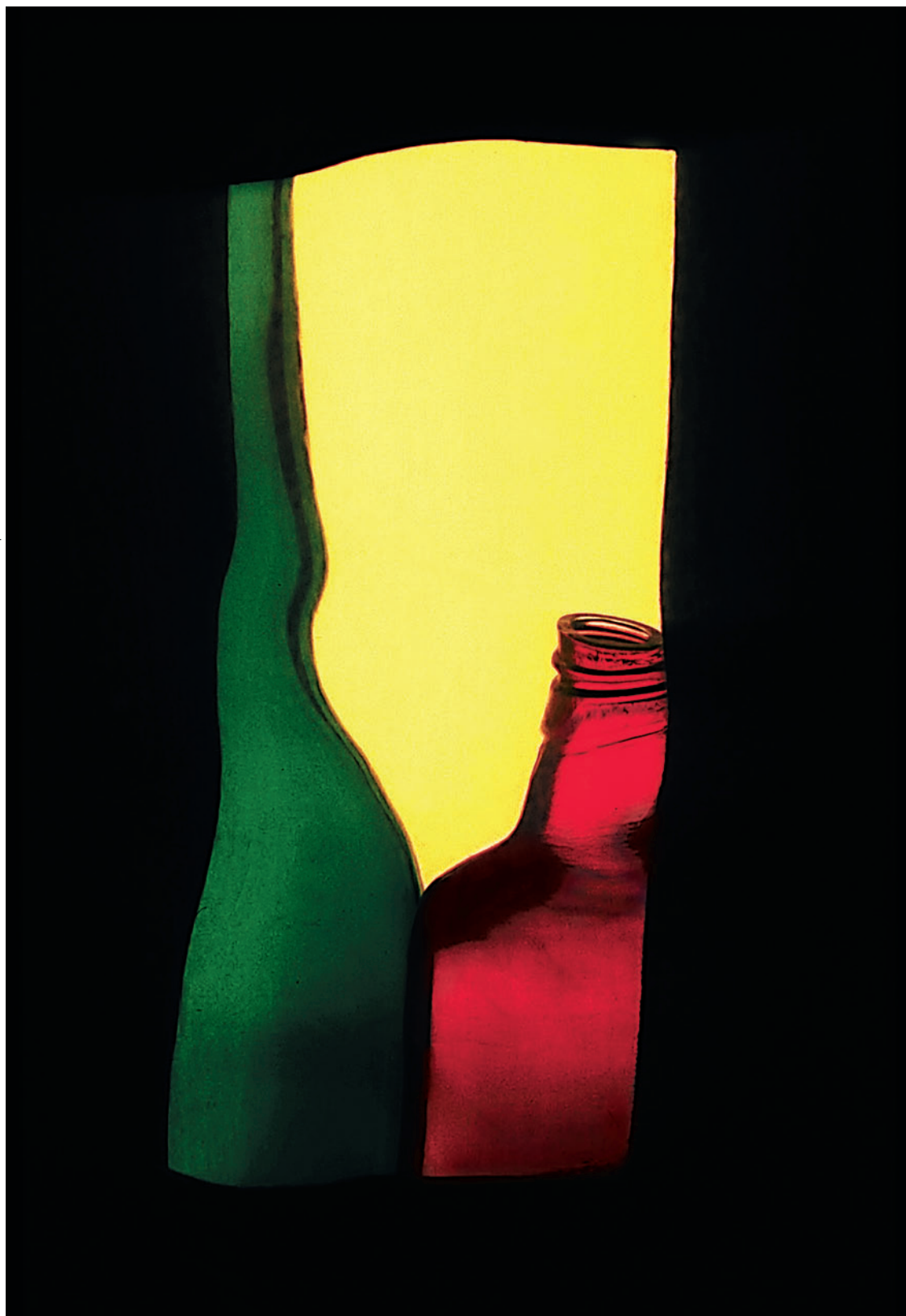
№7 «Портрет жены художника»

О. Розанова: «Мы предлагаем освободить живопись от рабства перед готовыми формами действительности и сделать ее прежде всего искусством творческим, а не репродуктивным»