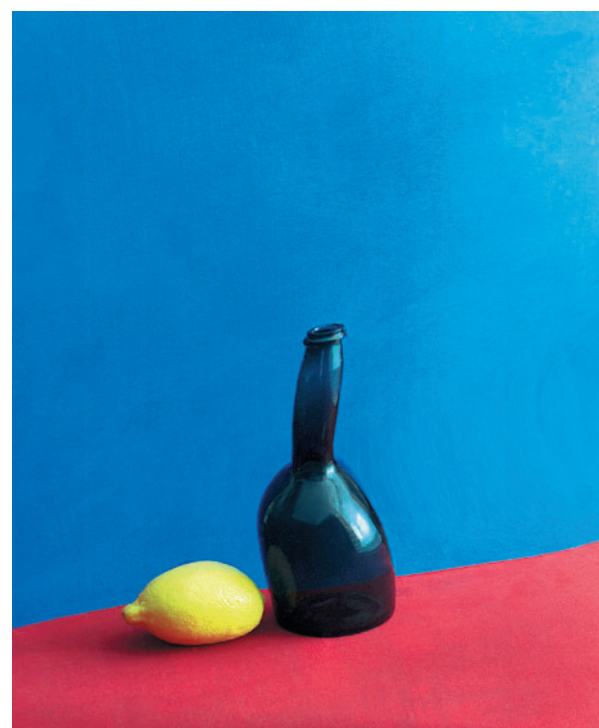
№8 «Лимон и бутылка»