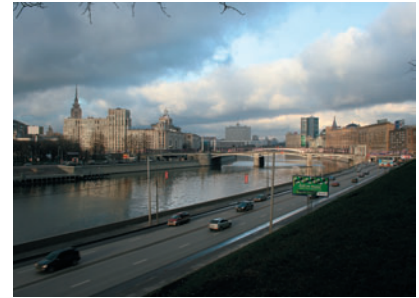
Широкий угол Штатный объектив грешит дисторсией и небольшим виньетированием.