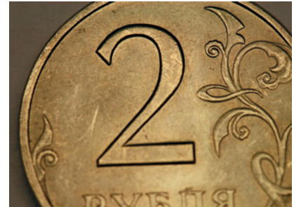
Макро Рекомендуем использовать специальный макрообъектив для съемки в натуральную величину.