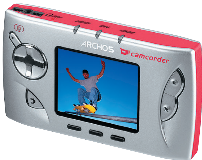
Можно купить альбом с 20-Гб жестким диском, USB-хостом и небольшим экранчиком. Габариты его будут не больше пачки сигарет

«Выбор конкретной модели будет зависеть от того, устройство какого размера вы готовы постоянно носить с собой»