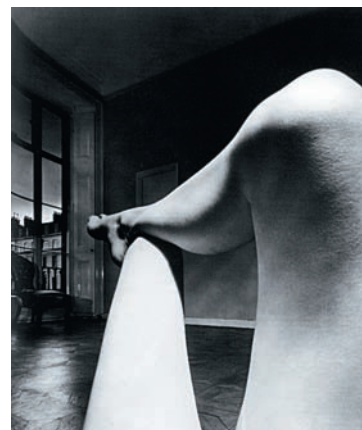
LONDON. 1951

G eorge Eastman House — пожалуй, самый крупный и увлекательный фото-музей в мире. Его экспонаты — это, по сути, антология мировой фотографии. От дагерротипа, калотипа и коллодиевых отпечатков к пленке, полноцвету, цифре и изыскам Фотошопа. Но если до двух последних нововведений Джордж Истман не дожил, то в пленке и полноцвете изобретатель разбирался получше других. Именно он в 1888 году основал компанию «Кодак», подарив планете метод Кодахром (впоследствии жестко конкурировавший с Агфаколором). Тогда же, очевидно, коммерсант начал по крупицам собирать наследие великих мастеров. В итоге архив разросся до почти космических размеров (400 000 работ) и безупречной хронологии — от Генри Робинсона и Шарля Негра до Себастьяну Сальгаду и Джоэла-Питера Уиткина, от вида из студии Нисефора Ньепса до постельных сцен от Нан Голдин. Последние годы жизни Джордж Истман потратил на благотворительность. В частности, на постоянной основе финансировал музыкальную