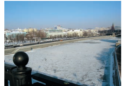
Широкий угол Минимальное фокусное расстояние объектива эквивалентно всего 37 мм.