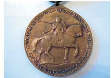
Макро Минимальная дистанция съемки — 5 см. А нужно ли больше?