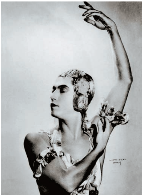
ФОТО ИЗ АРХИВА (СЕРЖ ЛИФАРЬ)