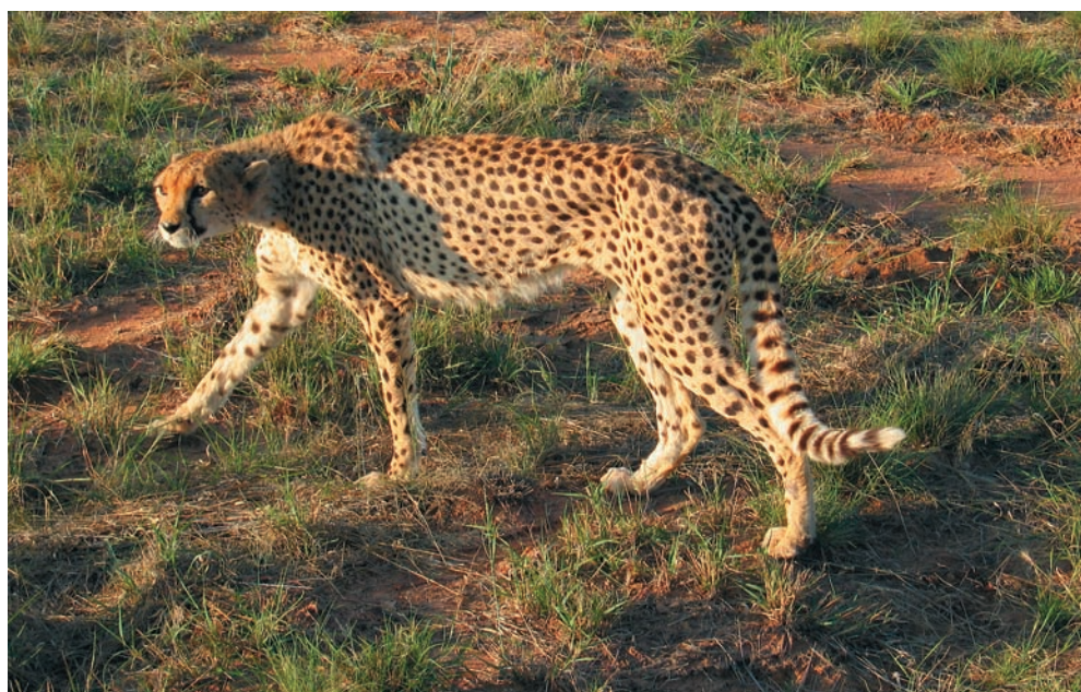
Встретить леопарда — большая удача, это очень стеснительное и осторожное животное