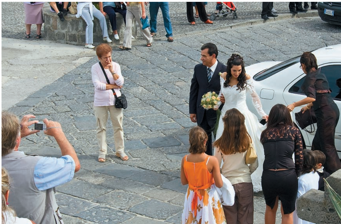
Сложность свадебной съемки заключается в том, что фотографу приходится работать в жанрах репортажа и портрета

Основное преимущество цифровых технологий состоит в легкости их эксплуатации. Цифровой фотоаппарат не связан с пленочной кассетой, поэтому может быть меньше и легче. Он позволяет видеть снимок сразу после съемки. Емкость цифровых носителей в сотни раз превосходит пленочные, а вес и габариты гораздо меньше. Карты памяти позволяют сохранять тысячи снимков, практически не занимая места. Путь фотографии от нажатия на кнопку спуска до снимка, который можно видеть и держать в руках, стал гораздо короче, но чтобы проще — пожалуй, нет. Рост возможностей по обработке цифровых фотографий обернулся очень серьезными требованиями к владению компьютерными технологиями. И, по мнению