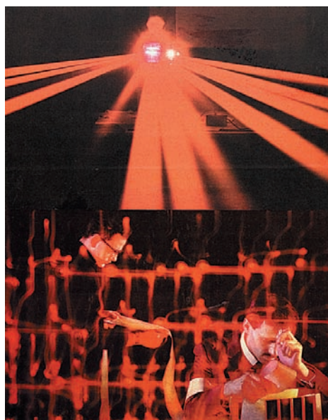
Первые лазерные лучи. Иллюстрация из журнала «РТ», 1967 г.