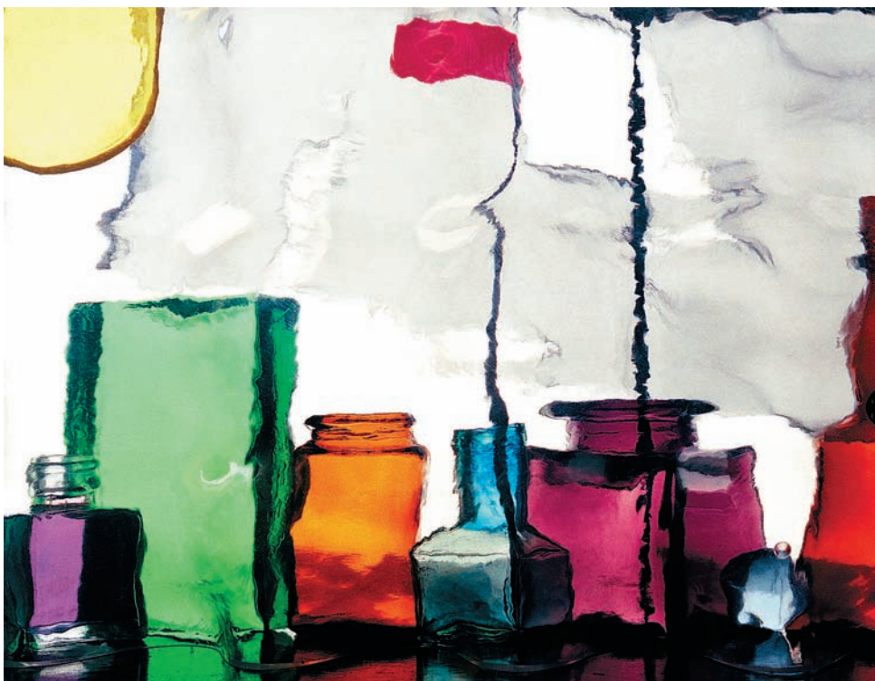
Фото 5. Вихри враждебные

«Да берите просто все, что вам не нравится, включите random и накладывайте друг на друга в Фотошопе. Тупо, конечно: шлеп, шлеп, шлеп, шлеп... О! Что-то получилось»