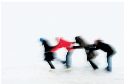
Фото 2. Фигурное катание