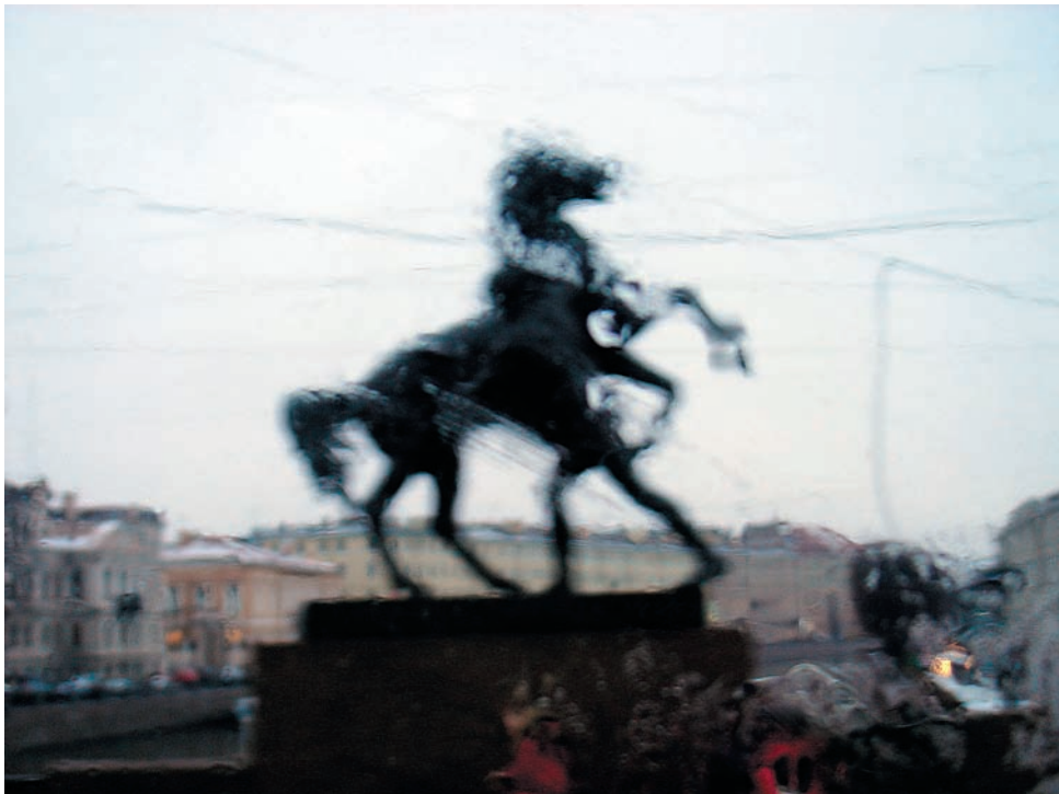
Фото 4. Аничков мост

А если взять, да и послать сотрудников Массачусетского института к черту? Запросто! Ведь, во-первых, сотрудники об этом не узнают, а во-вторых, среди фотографов затесалась «пятая колонна». Один из этих «отщепенцев», Картье-Брессон, писал: «Я с иронией отношусь к идеям некоторых лиц, использующих фотографические технологии с неумеренным стремлени-