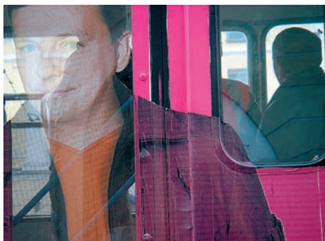
Фото 3. Розовый троллейбус