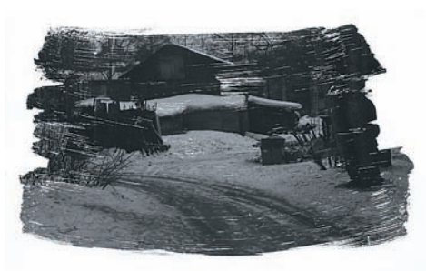
Фото 8. Тоскливый зимний вечер в маленьком городке