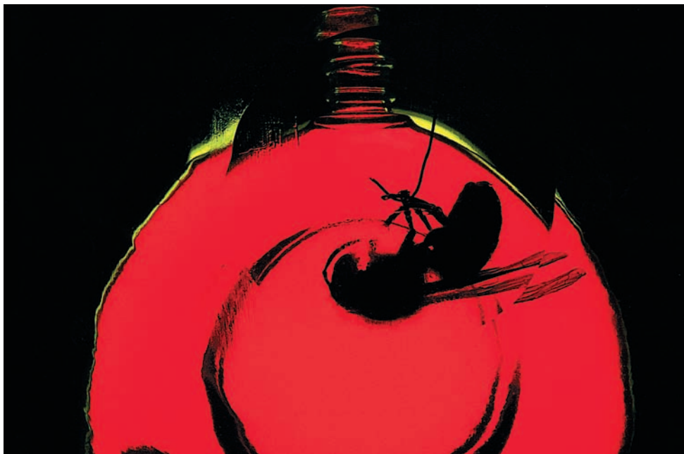
Фото 6. Маруся отравилась