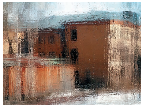
Фото 9. Мама мыла раму

пойти по скользкому пути классиков. Но как снимать нерезко, если вы уже потратили кучу денег на приличный объектив? А будем отыгрывать назад, так сказать, пешком к природе.