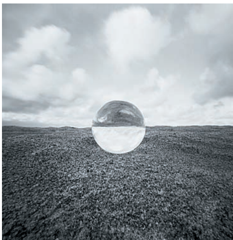
Фото 42. После дождя

черную пластмассу, дышу в ее единственное стеклышко и аккуратно протираю его штаниной перед выходом на съемку. Какие необыкновенные возможности у этой китайской «мыльницы» за 20 долларов! Ее