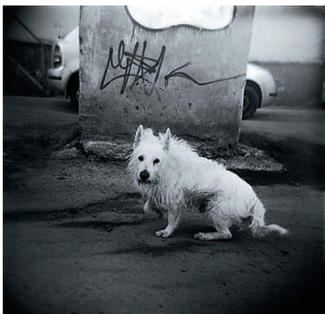
Фото 41. Автомобиль, скрипка и собака Клякса