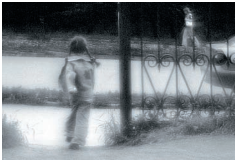
Фото 40. Ушла