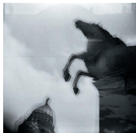
Фото 44. Петербург

И, наконец, давайте все-таки покончим с объективом, даже если он из одной линзы, и та из пластика. Да ну его совсем! Смотрите, вот пинхол — ящик с дыркой, стоит меньше ста долларов, весит каких-то 200 г, влезает запросто в карман ветровки. Штатив иметь необязательно. В качестве подставки подойдет доска, кирпич, торчащий из воды камень, бордюр, забор, да