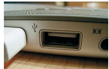
Макро Минимальная дистанция съемки — 3 см. Неплохо, но возможны проблемы с освещением объекта съемки.