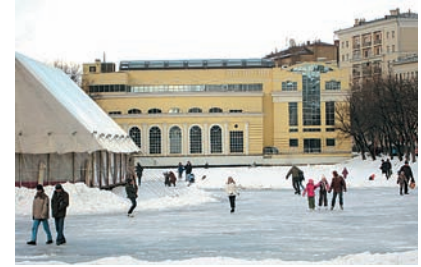
Телеположение IXUS 860 IS не подойдет для съемки «а-ля папарации» — максимальное фокусное расстояние всего 105 мм.