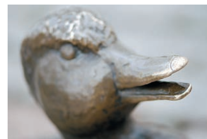
Макро Хотя видоискатель и небольшой, но вручную точно сфокусироваться все же возможно.