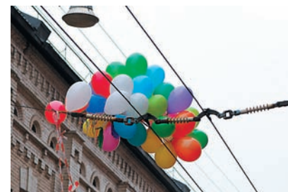
Цветопередача Все на своих местах, ручная установка баланса белого возможно и понадобится, но только в действительно сложных условиях.