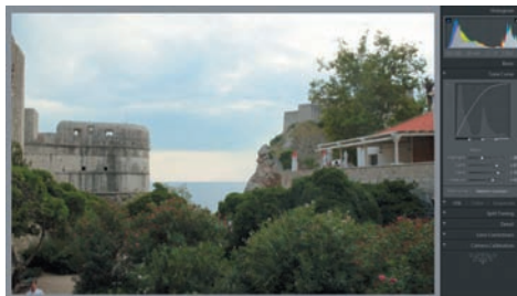
Тональная коррекция осветляет изображение и проявляет на нем детали. Общее качество снимка становится более удовлетворительным