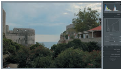
Нестандартная тональная кривая позволяет более полно выявить особенности конкретного снимка проработкой светов и теней. Хотя, на первый взгляд, это может ухудшить изображение

Говоря о тональной коррекции, мы подразумеваем известный по Photoshop инструмент Curve (Кривые), который также присутствует в каждом уважающем себя RAW-конвертере. Эти кривые могут быть встроены в конвертер как предустановки, и в этом случае фотограф может выбрать нужную из готовых или, если есть возможность, создать ее вручную. Можно сказать, что этим же различаются и фотоаппараты, снимающие в RAW и JPEG, — вторые используют встроенную в себя тональную кривую, которая улучшает все снимки без учета их особенностей. В среднем выходит терпимо и иногда хорошо. Использование