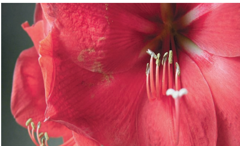
См. материал на стр. 24